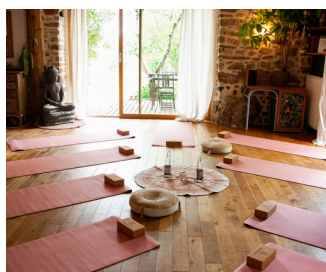
SALLE DE PRATIQUE