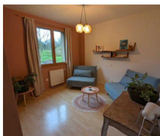
SALLE DE CONSULTATION